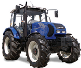
FT 685 DT